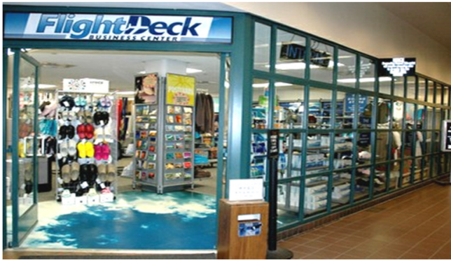
Fight Deck ★3号店出入り口前 ↑ 時間外返却ボックス ★3号店のみ設置