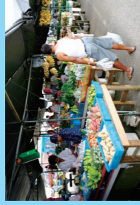
デデドの朝市はローカルの生活に 触れるチャンス。 B級グルメもお勧め (土・朝6時頃~9時頃)