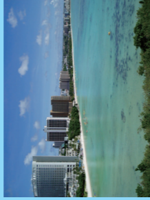
グアムの中心地、タモン湾

グアムは3時間あれば車で1周できてしまうコンパクトな島。観光にしても1日、半周なら半日もあれば十分に楽しめる。おすすめは、グアムの魅力がぎゅっと詰まった南部半周。タモンを出て1号線を南下し、グアムらしい海岸線を右手に進むと、次に現れるのは意外にも緑濃いグアムの山々。展望台から見下ろすジャングルや青い海は圧巻だ。その先の南部では、小さな村のティーブな雰囲気が感じられる。そのまま4号線で島を横切り、夕陽は西側のハガニア、タモンで楽しむ。