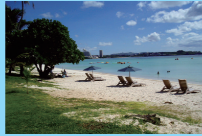
白砂のビーチが広がるタモン湾。 日常を忘れてのんびり過ごしたい