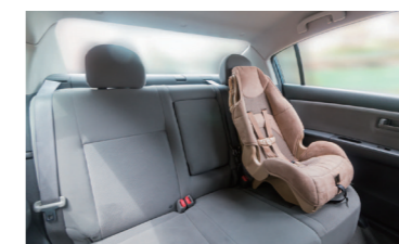
子供用安全シート (体重9~18kgで身長102cmまでの子供用)