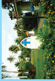
最南端の村、メリッツォ。 写真は聖母マリア・カマリン公園