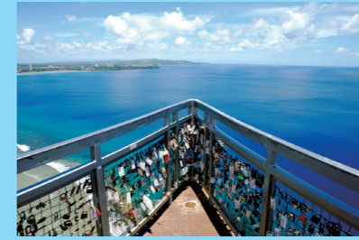
恋人岬はタモンの繁華街を見下ろす 絶景ポイント