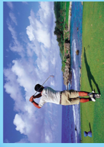
オンワード・マンギラオ。 ゴルフコースの各物海越えホール