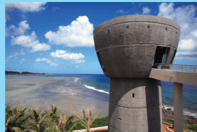
アデラップ岬のグアム政府内にある ユニークな展望台「ラッテ・オブ・フリーダム」