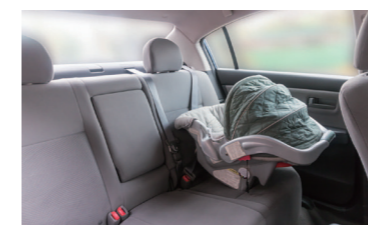
幼児シート (1歳以下で体重9kgまでの幼児用)

日本では6歳までの子供に使用が義務付けられているが、グアムでは公法30-33で4歳以下の子供は子供用カーシート、 4~11歳で身長が145cm未満の子供はブースターシートの使用が求められている。 子供連れの場合は年齢、体格にあわせたシートのレンタルもあわせて必要になる。