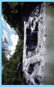
グアムで最大の幅を誇る タロフォオの滝。 リゾートパーク内にある