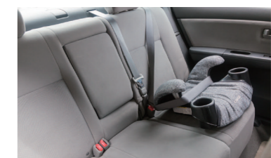
子供用ブースターシート (体重18~36kgで身長145cmまでの子供用)