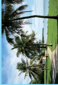
アガットにはピクニックできる ビーチパークが多い。 写真はニミッツ・ビーチパーク