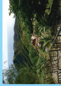
セツティ湾展望台からは海、 山の景色が楽しめる