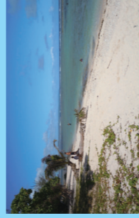
穴場的なイバンビーチ。 人が少ないので身の回りには注意