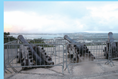
スペイン時代に造られたサンタ・アグエダ塔。 タモン湾も一望できる