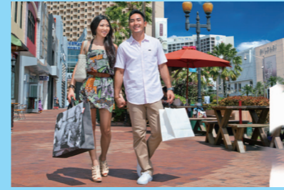
ホテル・ロードのなかでも北部はグルメ、 ショッピング、エンターテイメントがそろっ 賑やかなエリア