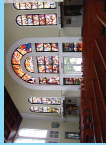
歴史・文化の見どころ多いハガニア。 写真は聖母マリア大聖堂