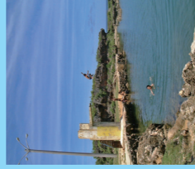
特殊な地形でできた イナラハン天然プール。 海水なので熱帯魚も見られる