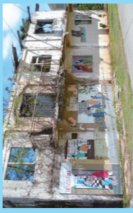
ティーブな魅力の多いイナラハン