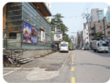
JUNGSUNGBON SHABUSUKIを 通り越してもっとまっすぐ行きます。