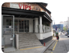
出口を出てすぐ左にVIPS (ファミリーレストラン)が見えます。