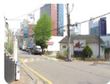
このVIPSとIVY歯科の建物の間にある小道に入ります。