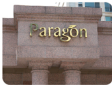
そうすると左手にParagon マンションが見えてきます。