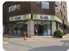
その対角線にCU(コンビニ) が見えます。