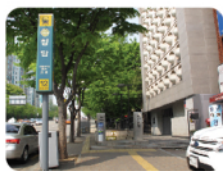
12番出口を利用します。